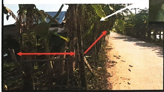
Kondisi tanaman warga dilihat dari arah menuju IPA Tanjung Seteko sebelah kiri