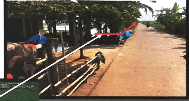
Kondisi Depan Rumah Pertama