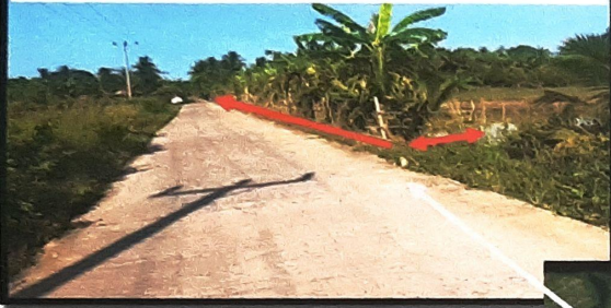
Kondisi tanaman warga, dilihat dari arah menuju Booster Al-Ittifaqiyah sebelah kanan